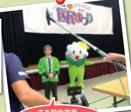
さあ開会宣言、稲嶺区長もはっぴを着て

問合せ 平野区民まつり実行委員会事務局 (平野区民センター) ☎6704-1200