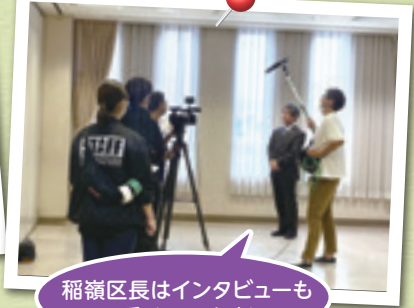
稲嶺区長はインタビューも受けています!