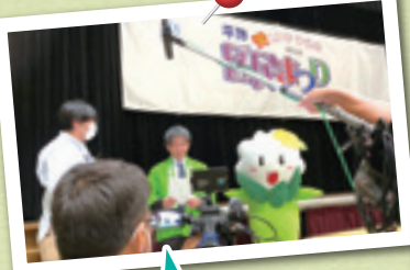
直前までディレクターと打ち合わせをしている姿です!