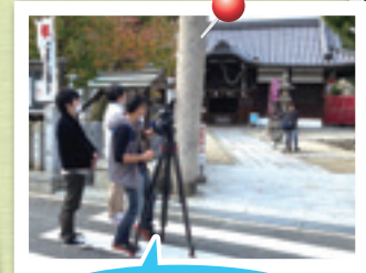
各地域の自慢場所にも撮影に行きました!