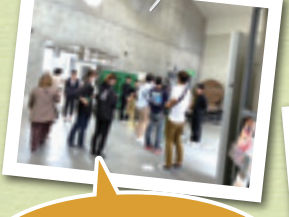
演奏し終わった中高生へインタビュー カメラに少し緊張気味?(笑)