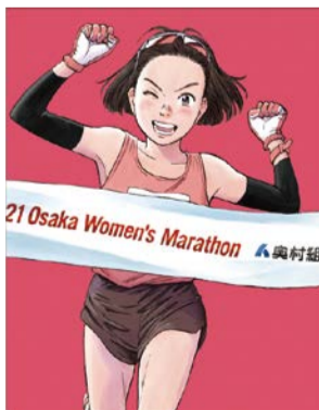
2021©浦沢直樹/N WOOD STUDIO

国内トップレベルの女性ランナーがヤンマースタジアム長居をスタート・フィニッシュとし、大阪城公園や御堂筋など市内を駆け抜けます。