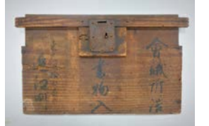
近江町会議所詰書物入(部分) 明治2年(1869年)頃 個人蔵

日 1/27(水)~3/1(月)9:30~17:00(入館は16:30まで)、火曜休館(火曜が祝日の場合は翌平日) ¥ 大人600円ほか 場 問 大阪歴史博物館 電話 6946-5728 FAX 6946-2662