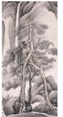
顧大申 《老松飛瀑図》(部分) 清時代・康熙3年(1664) 大阪市立美術館蔵(阿部コレクション)

中国では自然と人の生は常に連関して捉えられ、絵画の中にも表現されてきました。繁栄の象徴とされる松など自然を描いた作品を通して、先人の美意識や人生観に触れてみましょう。