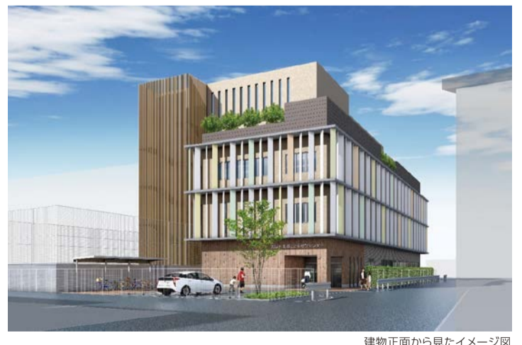
建物正面から見たイメージ図