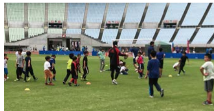
昨年のDo Sports Fes 2019の様子

モデル・女優の中条あやみさんをゲストにお招きし、トップチームのアスリートなどから指導を受けられるサッカーやバスケットボールなど、さまざまなスポーツの体験