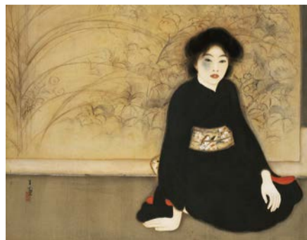
島成園 無題 大正7年(1918) 大阪市立美術館蔵(森本美津子氏寄贈)

大正期の大阪を駆け抜けた女性日本画家・島成園の没後50年にあたり、所蔵する作品を通して彼女の画業を振り返ります。 日 9/5(土)~10/11(日)9:30~17:00(入館は16:30まで)、月曜休館(9/21(月・祝)は開館) 場 問 市立美術館 ☎6771-4874 FAX6771-4856