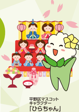
平野区マスコットキャラクター「ひらちゃん」