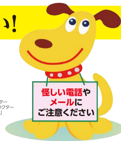
大阪市消費者センターメインキャラクター「エルちゃん」

不審に思った場合や、トラブルにあった場合は、大阪市消費者センターにご相談ください。(消費生活相談は大阪市にお住まいの消費者の方に限ります。)