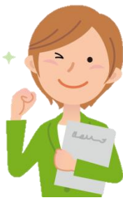
チーム員（医療・福祉専門職）