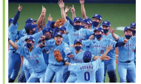
前回優勝チーム:大阪ガス

全32チームが出場し、社会人野球日本一を決定する最高峰の大会のチケットを500組1,000人にプレゼント。対象は市内在住・在勤・在学の方。詳しくは☎をご覧ください。 ☎ 10/30(日)～11/9(水)の間で開催(予定) 場 京セラドーム大阪 申 10/17までに☎で。 問 経済戦略局スポーツ課 ☎6469-3882 FAX6469-3898