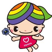
大阪市民権啓発 マスコットキャラクター 「にっこりーな」

私たち一人ひとりが人権の尊さを考え、すべての人の「人権が尊重されるまち」をみんなで築いていきましょう。専門相談員による人権相談(無料・秘密)