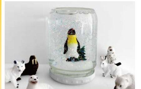
スノードームのイメージ

スノードームづくりなどを通して、下水道や水環境について親子で学べるワークショップなどを開催。日時はプログラムによって異なります。詳しくはHPをご覧ください。