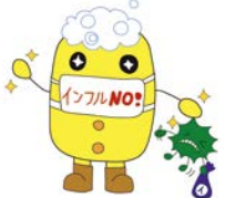
インフルエンザ対策 マスコットキャラクター 「マウテ君」

冬はインフルエンザが流行しやすい時期です。症状は風邪に似ていますが、高熱・頭痛・筋肉痛などの全身症状が強く、肺炎などの合併症を引き起こすこともあります。日頃から手洗いやマスクを着用するなどの咳エチケットを心がけ、予防しましょう。