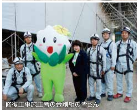
修復工事施工者の金剛組の皆さん