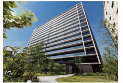
カサレウエストゲートシティ(住之江区)

第36回大阪市ハウジングデザイン賞表彰式にあわせて、シンポジウムを開催。これまでの受賞者とともに過去の受賞住宅を振り返りながら、これからの都市型集合住宅に求められるものについて考えます。定員100人(先着順)。