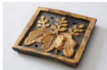
金箔桐文方形飾瓦 大阪市指定文化財 豊臣時代 大阪歴史博物館保管

豊臣秀吉が造った大坂城を象徴する金箔瓦や武家屋敷の屋根を飾った家紋瓦などの発掘資料を展示し、大坂城と城下町の姿を紹介します。