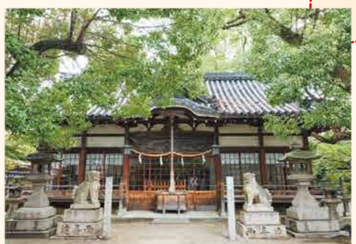
▲木に包まれるような緑豊かな境内。