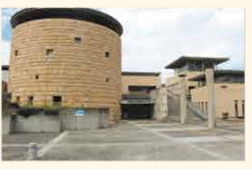
▲自分の隠れた才能が見つかるかも。

「出会いのよろこび」「学ぶ楽しさ」「創るよろこび」を感じていただく日本で唯一の総合工芸施設として、平成11年(1999)10月に開設した。木工・染色・織物・金工・ガラス・陶芸と多彩な分野の工房に充実した設備を備えている。