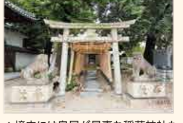
▲境内には鳥居が見事な稲荷神社も。