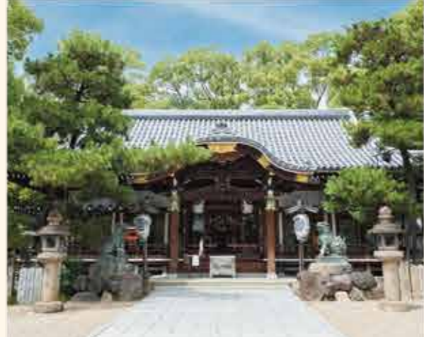
▲長い参道を進むと拝殿が。