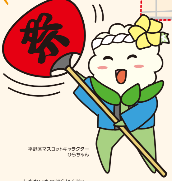
平野区マスコットキャラクター ひらちゃん