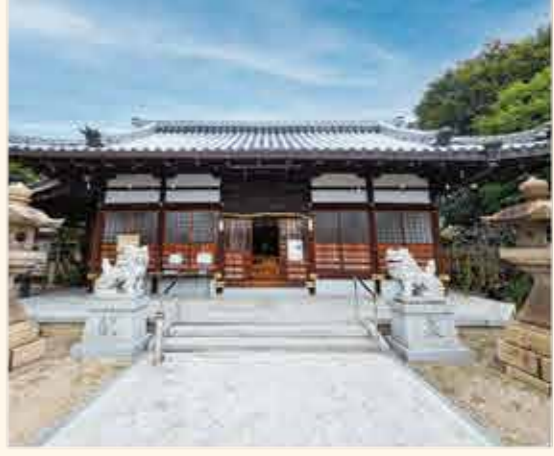
▲ヨガのイベントなども行われているとか。

もと天児屋根尊を祀り橘宮と称したが、のちに天神社と称して、菅原道真公を祀る。明治5年(1872)村社となり、さらに40年(1907)南鞍作村の無格社天照皇大神社、41年(1908)鞍作、新家村の村社菅原神社を合祀した。しかし、新家村の天神社は近時旧地に戻って独立した。神社奥には、鞍作、南鞍作、新家の三ヶ村を潤した三鞍作用水樋門の記念碑がある。