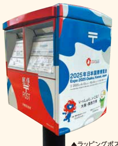
▲ラッピングポスト

万博開催機運を盛り上げるため、開催600日前の令和5年8月22日から、日本郵便株式会社平野郵便局のご協力のもと、「全国初」となる大阪・関西万博オリジナルデザインをまとったラッピングポストを平野区役所前に設置しています。また、平野区内の各小学校近くの23か所には大阪・関西万博オリジナルデザインをあしらったステッカーポストを設置しています。ぜひ、区民の皆様もこれら24基の郵便ポストの写真をハッシュタグ「#平野区万博」をつけてSNSへ投稿いただく等、共に大阪・関西万博の開催を盛り上げていきましょう！