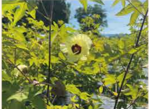
▲夏にはきれいなわたの花を見ることが出来ます。

昭和61年(1986)、(財)平野区コミュニティ協会設立10周年記念と平成2年(1990)開催の「国際花と緑の博覧会」に向け「区の花」を募集し、江戸時代からの綿業の歴史に基づき「わたの花」が選定された。毎年わた畑で栽培したわたを小学校の体験学習に提供している。