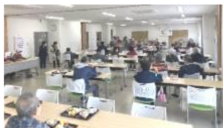
ふれあい喫茶（瓜破北地域）

づくり、居場所づくり活動への支援を積極的に行っていきます。このような地域活動は地域のボランティアが取り組んでおり、引き続き持続性のある地域活動となるよう、次世代育成の観点からSNSや様々な広報媒体を活用して、新たな担い手の発掘と育成を区社協、ボランティア・市民活動センター※と連携して取り組んでいきます。