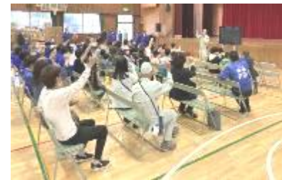
防災フェスティバル（平野地域）

② 災害時に福祉的な支援を必要としている人がいることが広く認識されるようになり、防災分野と福祉分野の連携が重要です。日頃から行われている地域のみなさんによる見守り活動等の地域活動は、顔の見える関係づくりに留まらず、災害時に支援の必要な人に対してどのようなサポートが必要であるかを把握する良いきっかけになります。大規模な災害が発生した場合、自身やご家族の安全確保だけでなく、隣近所を気にかける等、共助の意識を醸成する取組を進めます。また、緊急的な医療的措置が必要となる人が多数生じる恐れもあります。引き続き、自主防災組織や防災リーダー等が行っている防災訓練や避難所開設訓練と協働して防災意識を高める取組を行い、避難所での医療救護体制の検討にも取り組んでいきます。