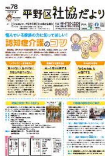
平野区社協だより

① つながりづくりは、みなさんが住んでいる身近な場所で取り組まれている様々な活動に参加していただくことから始まります。全戸配布している区の広報紙や区社協だより等の紙面を活用して区内各地域の活動を広く周知していきます。