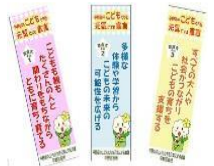
平野区のこどもたちを元気にする宣言文