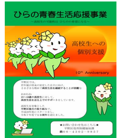
ひらの青春生活応援事業のリーフレット