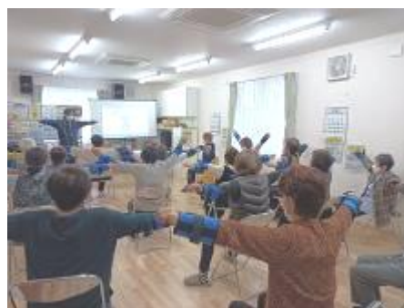
いきいき百歳体操(喜連西地域)