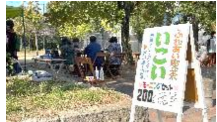
青空喫茶（喜連北地域）

③ 令和2年から拡大した新型コロナウイルス感染症の影響で、それぞれの地域で行ってきた活動や取組が制約を受けている状況です。地域活動の停滞により社会的孤立に陥る世帯や福祉的支援の必要性を見逃されるリスクが高まる可能性があります。新しい生活様式により、十分な感染症対策を行った地域活動への支援を行っていきます。今後も想定される新たな感染症への対策も、地域と情報連携しながら地域活動を支援していきます。