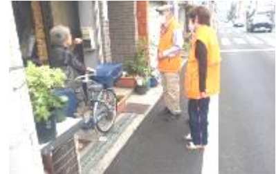
見守り訪問（瓜破西地域）