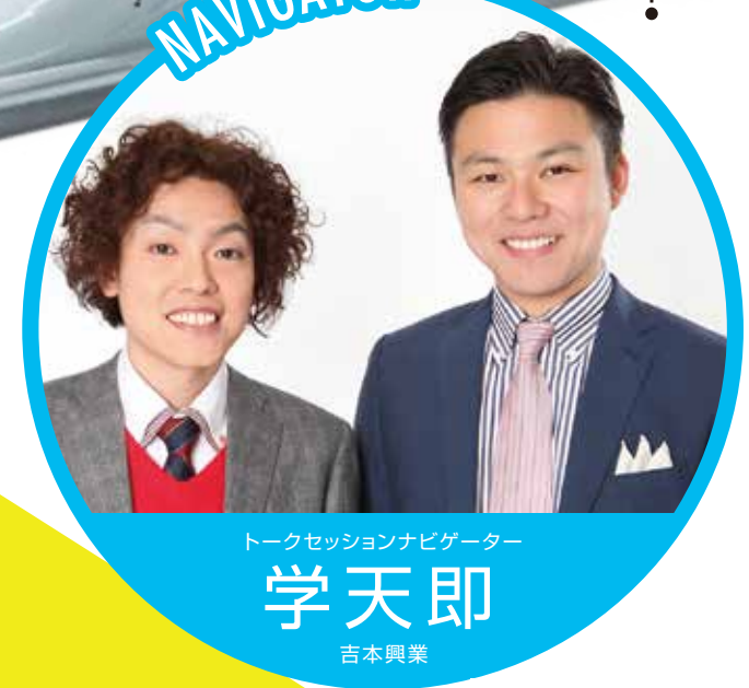
トークセッションナビゲーター