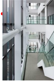
コミュニケーションボイド (ゼロエネルギースペース)