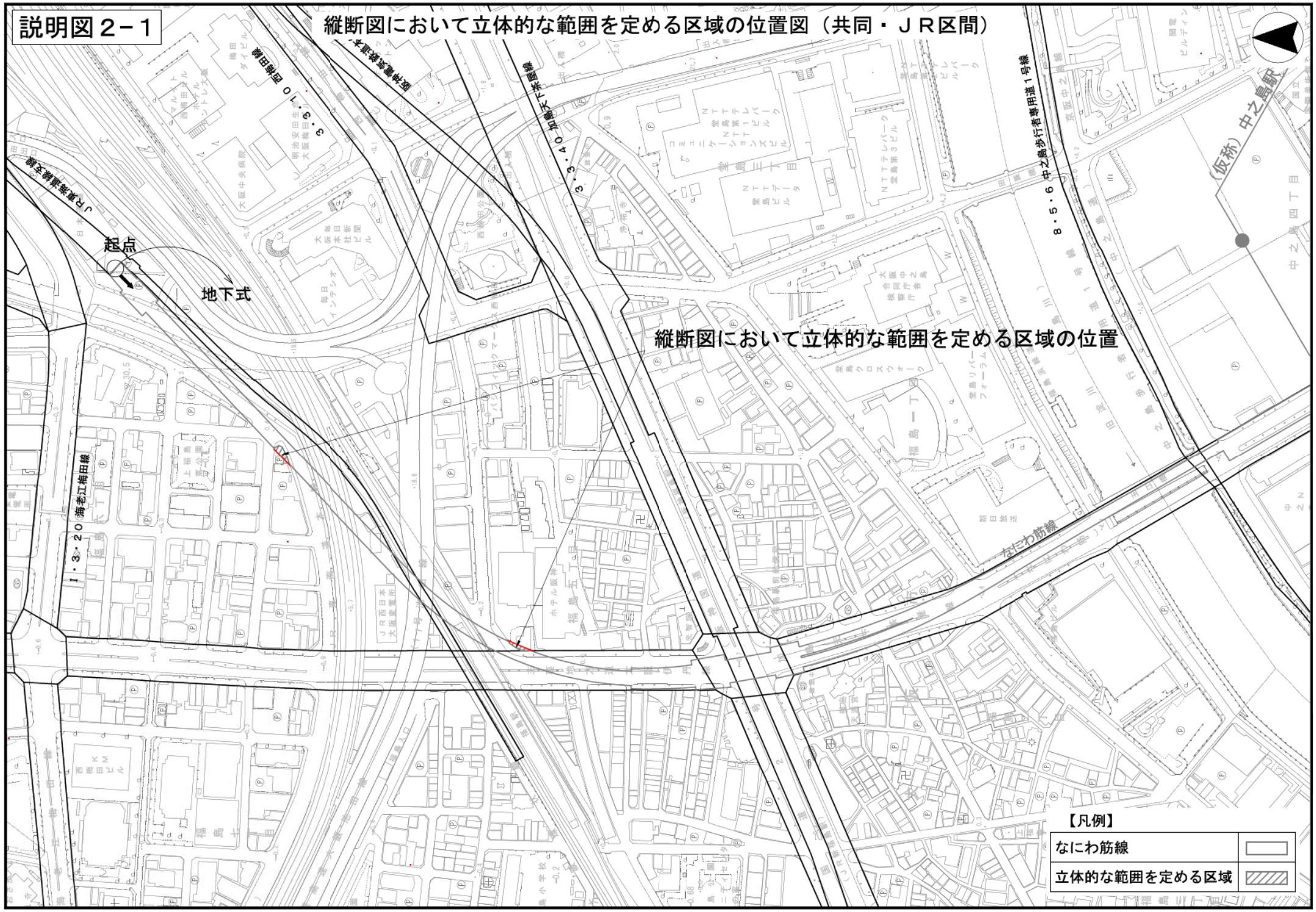
縦断面図において立体的な範囲を定める区域の位置図（共同・JR区間）