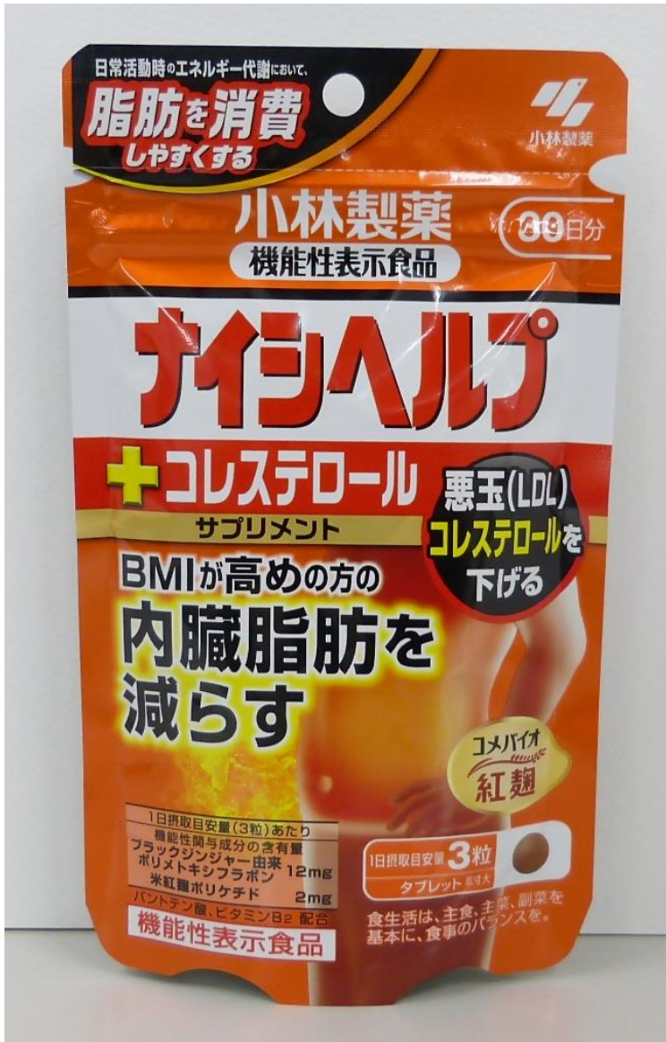
(3) ナイシヘルプ+コレステロール