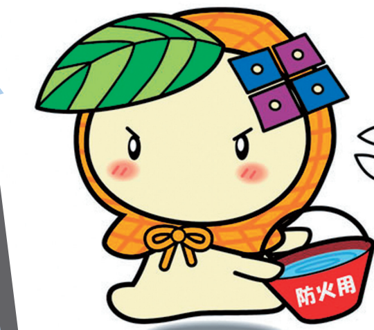
生野区キャラクター「いくみん」