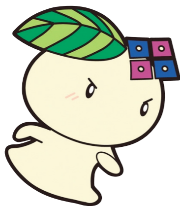
生野区キャラクター 「いくみん」