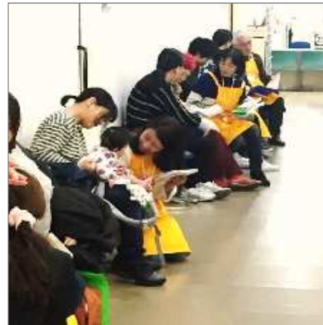
3ヶ月健診の際の絵本の読み聞かせの取組