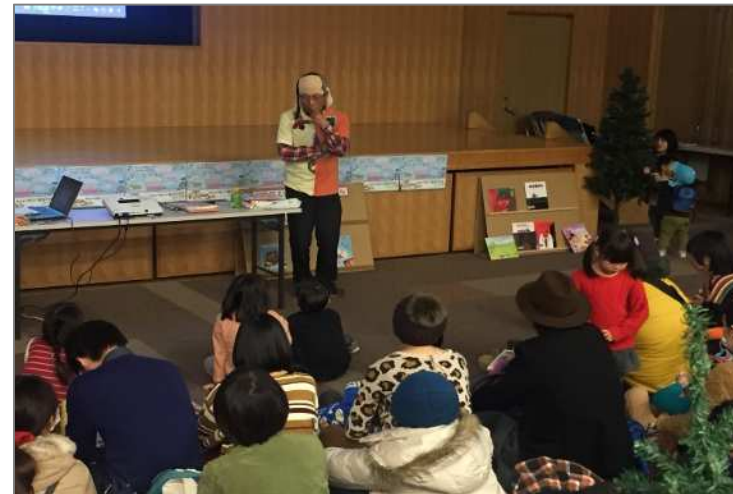
「みんなで楽しむ絵本PARK in いくの」の取組