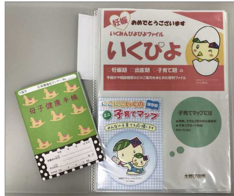
子育て情報ファイル「いくみんぴよぴよ」