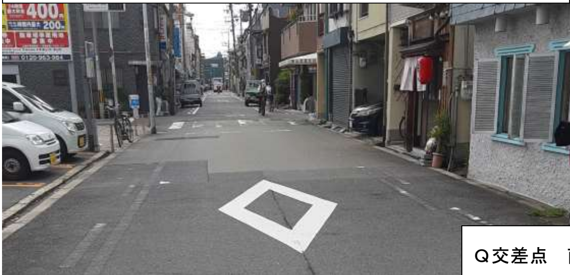
Q交差点 南北道路南側から北向き