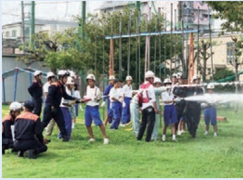
毎年9月に行われている異南小と新異中との合同防災学習の様子