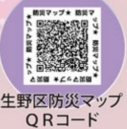
生野区防災マップ QRコード