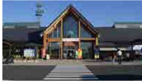
イメージ:道の駅 十文字 横手市観光推進機構

地元や近郊で採れたみずみずしい野菜、果物、野菜の加工品が並びます。地元で作られた手作りの漬物やスイーツも！特産品や名品、お土産物、手作り品などもあるよ。