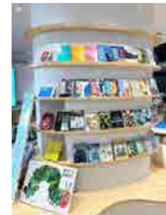
イメージ: 図書室のない学校。 校舎全体が図書室に。 追手門学院大手前 中・高等学校

校舎の二階には市民型図書館があり、フロア全体が図書館になっています。廊下にも本が並びます。ここでは、いつでもどこでも自由に本を読むことができます。寝そべて読んでも、ごろごろしてもいいです。一般書のほかにとくに世界のことを学べる本がたくさん！