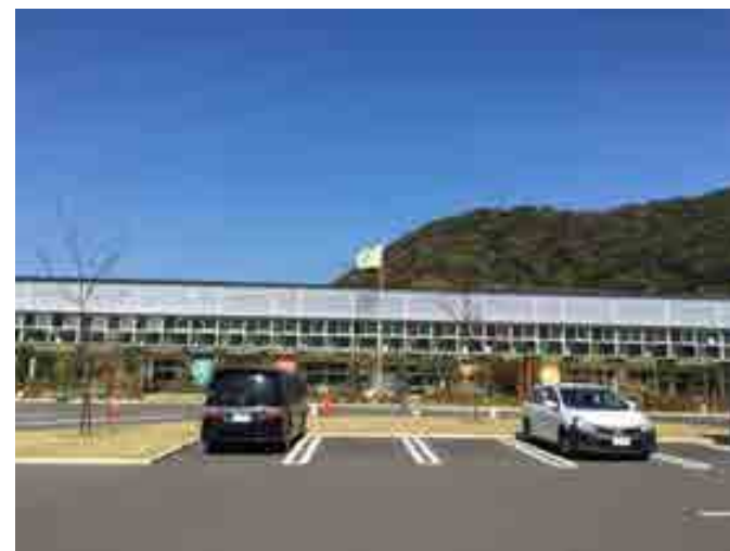
道の駅情報サイト 未知倶楽部