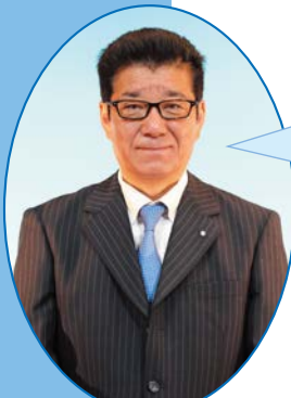
大阪市長 松井一郎

現在の大阪市は、住民に身近な行政と広域的な行政、その両方を担っています。特別区制度のポイントの一つは、特別区と大阪府の 役割分担を徹底 することです。