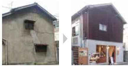
改修イメージ(改修前→改修後)

空家の利活用を予定されている方に、住宅の性能向上や、こども食堂・高齢者サロンといった地域まちづくりのための用途に改修する費用等の一部を補助します。補助内容など、詳しくは☎をご覧ください。