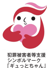
犯罪被害者等支援シンボルマーク「ギュっとちゃん」

犯罪の被害にあわれた方やその家族・遺族の方への支援をより一層充実させるため、「大阪市犯罪被害者等の支援に関する条例」を制定し、さまざまな支援に取り組んでいます。詳しくはHPをご覧ください。