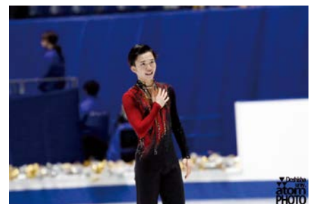
2018年男子フィギュアスケート世界選手権5位 オータム・チャレンジ・スポーツ2020応援アスリートの友野一希選手

オータム・チャレンジ・スポーツ2020応援アスリートの友野一希選手などが出演するアイスショーと、友野一希選手や大阪府スケート連盟による体験教室を開催。申込方法など詳しくはHPをご覧ください。