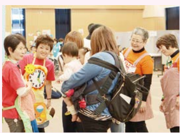
▲「いくのっこ広場」での様子。近所の人と笑顔であいさつを交わす、地域の子育てイベントに関わってみるなど、できることからお願いします!

児童虐待のリスクは、誰にでもあります。私にも、ありました。頼れる人がいない、悩みをうまく言葉にできない、生活不安、こどもの発達への不安……。心の限界点を超える前に、「子育てしんどいねん」が言えるまちなしにしたい。今、児童虐待により心身のリスクがあることを守りながらも、家庭の抱える課題の解決や予防に努めています。「まちぐるみ子育て」へのご協力を、どうぞよろしく願います。