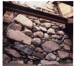
今も地下に眠る豊臣石垣