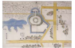
摂津州大坂茶臼山陣営図