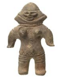
山形土偶 茨城県稲敷市椎塚貝塚 縄文時代後期後半 (紀元前1800年) 大阪歴史博物館蔵