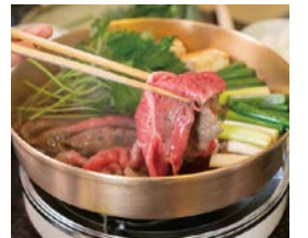
食文化体験プログラム 提供料理のイメージ