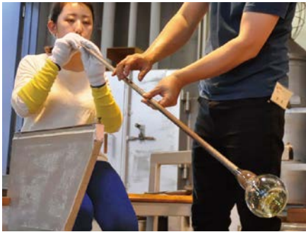
吹きガラス教室の授業風景