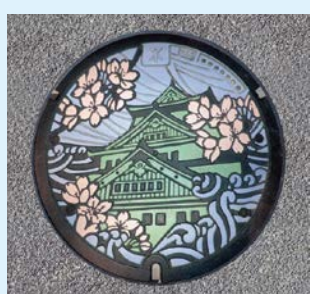
下水道事業100周年記念デザイン