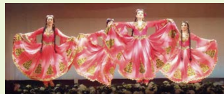
シルクロード・ローラン歌舞団

問合せ 大阪市コミュニティ協会(生野区支部協議会) ☎06-6716-3020 FAX06-6716-1797