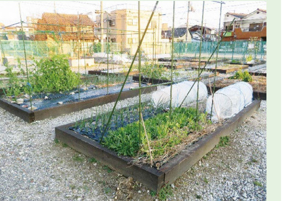
▲コミュニティ農園「むすびファーム」