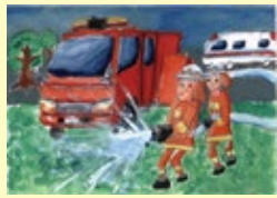
佳作(巽南小学校5年生)

上記2作品含む、生野区内の小学生による防火・防災の願いが込められた図画は、生野消防署HPでご覧いただけます!▶