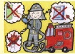
優秀賞(林寺小学校6年生)