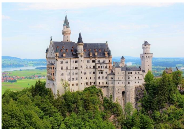
▲ ノイシュヴァンシュタイン城

大都市なんだけど、旧市街が残っていたり古城や教会があって美しいところなんだ。日本でもよく走ってるBMW社の本社がミュンヘンにあって、僕は日本に来る前そこで働いてたんだ。日本語をしゃべれたら仕事の幅が広がると思って日本に来ることを決めたよ。