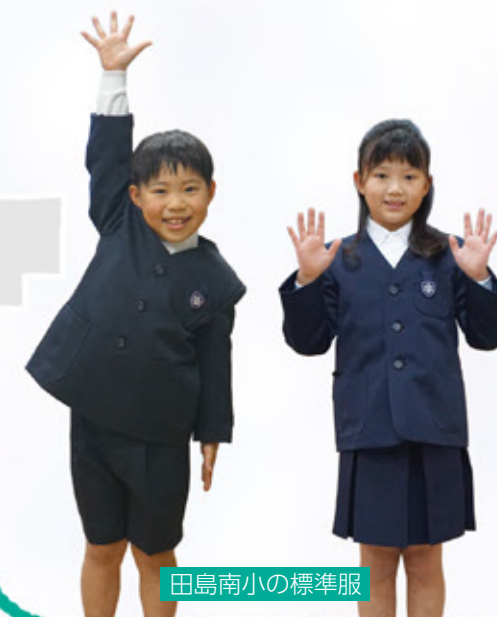
田島南小の標準服

小学校では、働くことの大切さの理解、興味・関心の幅の拡大等、社会性を養い、中学校では、社会における自らの役割や将来の生き方、働き方を考えさせ、自分らしい生き方を実現するための力を育みます。