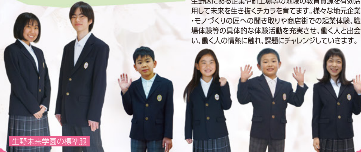
生野未来学園の標準服

義務教育学校では教職員が一体となって9年間を通して子どもたちを育てていきます。そのため9年間で4・3・2の3つのステージに分けて、子どもたちの発達段階に応じた形で学校教育・学校行事を行います。