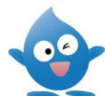
水道局 イメージキャラクター 「びゅあら」

転入者が多い3月・4月は、日曜・祝日も水道の使用開始・中止等の各種届出、漏水の連絡などを受け付けます(月~金は8:00~20:00、土日祝は9:00~17:00)。また、各種届出はHPからも申し込みます。 問 水道局お客さまセンター ☎6458-1132 ☎6458-2100