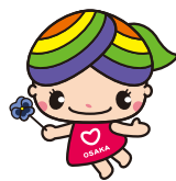
大阪市人権啓発 マスコットキャラクター 「にっこりな」

地域には病気や障がい、介護、子育てなど配慮や支援などが必要な方がいます。過剰な詮索や本人の承諾を得ずに第三者に情報を伝えることは人権侵害につながります。年度替わりを迎え地域の顔ぶれが替わるなか、一人ひとりが地域で快適に暮らせるよう、お互いのプライバシーを尊重しましょう。人権啓発・相談センターでは、専門相談員が人権に関するさまざまな相談をお受けしています(無料・秘密厳守)。☎6532-7830(なやみゼロ)・☎6531-0666・✉でご相談ください。