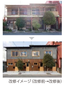
改修イメージ(改修前→改修後)

空き家の利活用を予定されている方に、住宅の性能向上のための改修や、こども食堂・高齢者サロンといった地域まちづくりのための改修