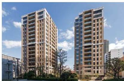
第34回ハウジングデザイン賞 受賞住宅 ※他に特別賞受賞住宅もあり

魅力ある良質な集合住宅を表彰する「大阪市ハウジングデザイン賞」を実施。推薦いただいた方の中から抽選で50人に図書カード(500円分)をプレゼント。 問 市役所・区役所・大阪市サービスカウンター(梅田・難波・天王寺)などで配布する推薦ハガキ付きリーフレットに必要事項を記入し、6/20までに☎都市整備局住宅政策課へ送付。HPからも申し込み可。 ☎6208-9226 FAX6202-7064