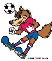
セレッソ大阪 チームキャラクター 「ロビー」

舞洲プロジェクトが開催するサッカースクールの参加者を募集。セレッソ大阪のホームスタジアムでスクールコーチによる実技指導を受けられます。対象は市内在住の小学生。定員150人。 問 6/26(日) 13:45～15:15 場 ヨドコウ桜スタジアム 料 参加料:2,000円(セレッソ大阪当日試合観戦ペアチケット付き) 問 6/15までにホームページで。 問 経済戦略局スポーツ課 ☎6469-3882 FAX6469-3898