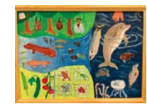
令和3年度 特選賞(4年生)