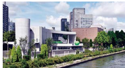
第40回大阪市長賞:こども本の森 中之島 撮影者:安藤忠雄建築研究所

周辺景観の向上に資し、かつ景観上優れた建物やまちなみを推薦していただき、特に優れたものを表彰します。