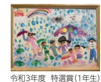
令和3年度 特選賞(1年生)