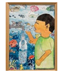
令和3年度 特選賞(5年生)