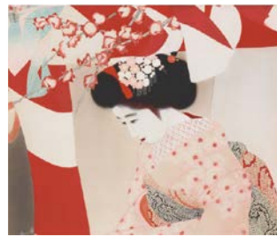
北野恒富「宝恵籠」昭和6年(1931)頃 大阪府立中之島図書館