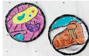
マンホールふたデザインのイメージ

日 2/26(日)まで 場問 下水道科学館 ☎ 6468-1156 FAX 6468-1160