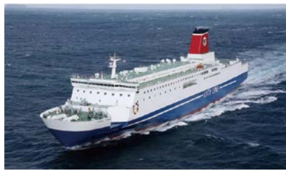
フェリーふくおか

大阪港に就航する大型フェリーで、明石海峡大橋を眺めながら、大阪湾をめぐる。定員300人。小学生以下は保護者同伴。