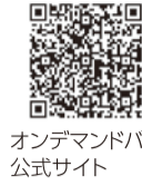
オンデマンドバス 公式サイト