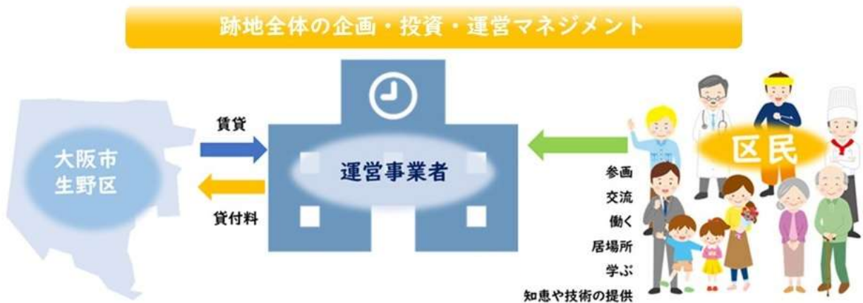
跡地活用スキームのイメージ図

転貸は原則として禁止とする。ただし、貸付の趣旨に相応しいものとして、事前に本市が承認した場合に限り、必要最小限の範囲で第三者への転貸を可能とする。（賃借権の第三者への譲渡は原則禁止）