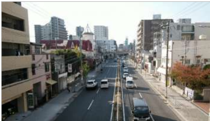
生野のメインストリート：勝山通

勝山地域は生野区の南西部に位置し、地域の北端には桃谷駅前商店街を始めとした約 0.5km に及ぶ商店街があり、地域の南端には国道 25 号線が走り、南は阿倍野区と、西は天王寺区と隣接している。小学校から 1 km 圏内に JR 桃谷駅と JR 寺田町駅があるほか、小学校から 1.5 km 圏内に大阪市南部の交通ターミナルである天王寺駅がある。また、生野のメインストリートである勝山通（四天王寺の東門から東へ約 3 km の難波足代線）を隔てて南北に位置し、交通の利便性に優れた地域である。小学校周辺には私立幼稚園や私立中学校、私立高等学校が立ち並び、学びの場に適した文教地域となっている。