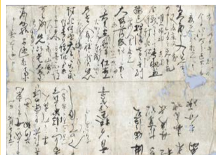
京都から大坂落城の火災を目撃したと語る書状の写し(大阪城天守閣蔵)

戦国最大の合戦・大坂の陣。同時代史料に見る「実録」と、長い年月の間に浸透した「創作」で、決戦から410年が経った今もなお、私たちに魅了する虚実の逸話を紹介します。