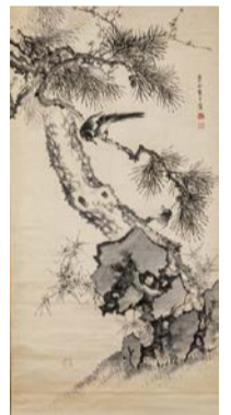
松竹梅鳥図 藪長水 個人蔵

京阪で活躍した絵師や書家の手による掛軸など、江戸時代が終わりへと向かう動乱期に、大阪の芸術文化を支え続けた商家・浅野家秘蔵のコレクションを紹介します。