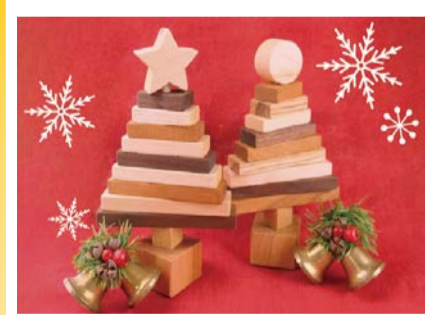
木工作品イメージ

吹きガラス・陶芸・織物・木工・金工など10種類の本格的な工芸体験ができる体験教室。定員2～12人(先着順)。空きがあれば当日参加もできます。各教室の対象年齢や費用など、詳しくはHPをご覧ください。