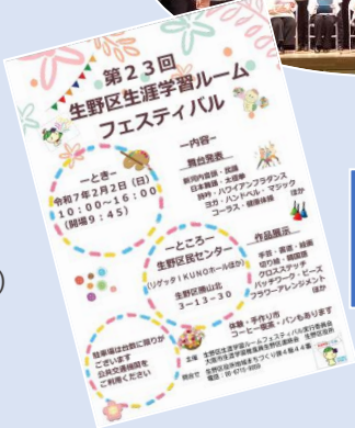
生涯学習ルームフェスティバル