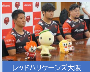
レッドハリケーンズ大阪