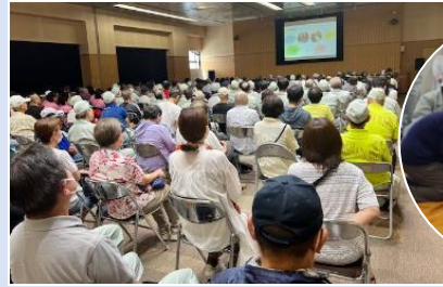
地域防災リーダー研修