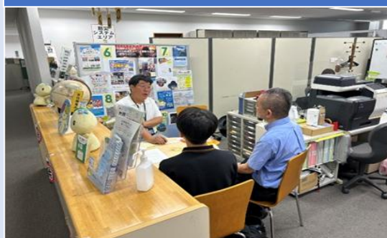
「いくのの日」市民活動相談会