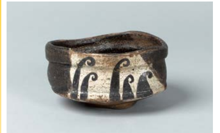
黒織部波文茶碗 松恵コレクション 桃山時代(17世紀)美濃窯

初公開の茶道具を中心とした「松恵コレ クション」や、中国陶磁の酒器を中心とし た「入江正信コレクション」などを、オム ニバス方式で紹介します。