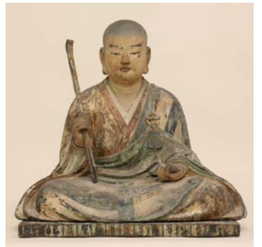
重要文化財 木造僧形八幡神像 正平8年～9年(1353～1354) 壺井八幡宮蔵

源義家や源頼朝、足利尊氏らを輩出し、 武士の世の礎を築いた河内源氏一族と、 彼らの守護神として長らく武家の崇敬を 受けた壺井八幡宮の歴史を紹介します。