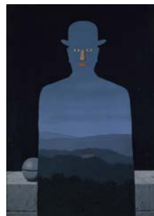
ルネ・マグリット 《王様の美術館》1966年 横浜美術館