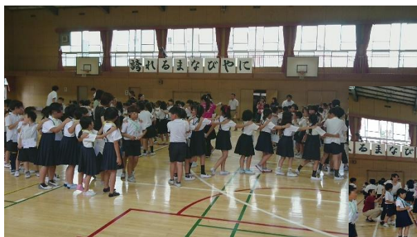
← イングリッシュデイ

準備会において、現在学校に在籍する子どもたちのためにできる取組について意見交換があったことを踏まえ、小学生同士の交流の場として、6月15日（金）に6年生の授業体験、6月27日（水）に3年生のイングリッシュデイ（英語活動による交流）を開催しました。4小学校の児童が生野中学校に集まり、通常よりも大きな規模での活動を行うことができ、子どもたちは楽しんでいました。同様の取組を2学期以降も実施する予定です。