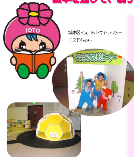
城東区マスコットキャラクター コスモちゃん

絵本を通じて、親子のふれあいや、親同士のコミュニケーションなど、子育てを応援します。