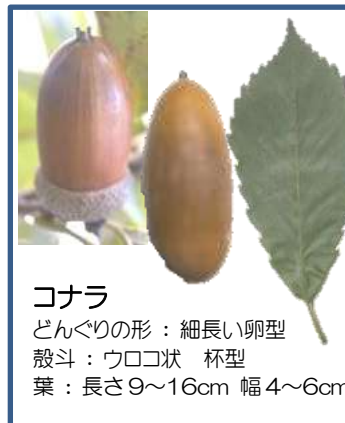
コナラ どんぐりの形: 細長い卵型 殻斗: ウロコ状 杯型 葉: 長さ 9~16cm 幅 4~6cm