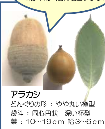
アラカシ どんぐりの形: やや丸い樽型 殻斗: 同心円状 深い杯型 葉: 10~19cm 幅 3~6cm

俗に「ぼうし」「はかま」と 呼ばれる部分のことを 「殻斗(かくと)」と言います。