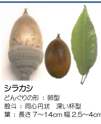
シラカシ どんぐりの形: 卵型 殻斗: 同心円状 深い杯型 葉: 長さ 7~14cm 幅 2.5~4cm

俗に「ぼうし」「はかま」と 呼ばれる部分のことを 「殻斗(かくと)」と言います。