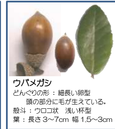
ウバメガシ どんぐりの形: 細長い卵型 頭の部分に毛が生えている。 殻斗: ウロコ状 浅い杯型 葉: 長さ 3~7cm 幅 1.5~3cm

南関目公園のどんぐり広場には 7 種類のどんぐりの木があります。 園内にはそれぞれのどんぐりの 木の紹介の立て看板もあります。 見つけられるかな?