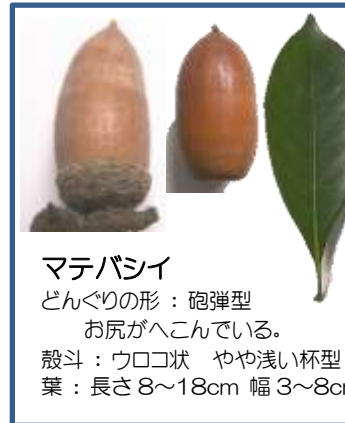
マテバシイ どんぐりの形: 砲弾型 お尻がへこんでいる。 殻斗: ウロコ状 やや浅い杯型 葉: 長さ 8~18cm 幅 3~8cm