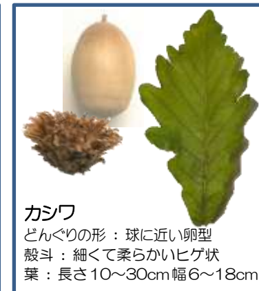
カシワ どんぐりの形: 球に近い卵型 殻斗: 細くて柔らかいヒゲ状 葉: 長さ 10~30cm 幅 6~18cm