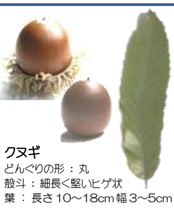
クヌギ どんぐりの形: 丸 殻斗: 細長く堅いヒゲ状 葉: 長さ 10~18cm 幅 3~5cm

日 時: 平成 27 年 11 月 3 日(火・祝) 9:30~12:30 場 所: 南関目公園どんぐり広場 ※雨天の場合は近くの屋内会場で実施します。(当日公園に案内表示) 内 容: どんぐりころころゲーム、どんぐりクイズ、どんぐり工作、葉っぱの魚釣り、どんぐりつかみ、その他楽しい遊びがいっぱい! 参加費: 100 円 主 催: 城東どんぐりまつり実行委員会 問合せ: ほっとステーション・しどろもどろ TEL06-6935-8386