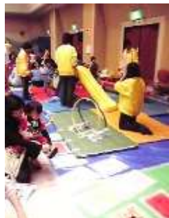
↑写真1 ダンボール自動車 ←写真2 ミニ遊具 係りの人が補助してくれ るので安全に遊べました

蒲生中公園ではミニパト、白バイ 消防車と記念撮影ができる 写真撮影コーナーも大人気でした(*^_^*)