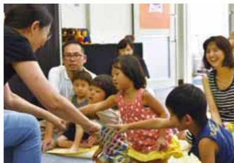
わらべ歌にあわせて「どっちかな?」「こっち!」

子育てをしていた頃、「地域のコミュニティ」の必要性を強く感じていました。地域のために「何かできないか」と思っていたとき、『ふれあい城東』に「絵本読み聞かせ」ボランティア募集記事を見つ