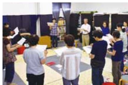
全員そろって発声練習。「さしすせそは涼しそう、さやさや、そよそよ、せ、すすき」皆さん囁まずにすらすらと読んでいます。さすが!

けました。自分の子どもも、ボランティアさんに絵本を読んでもらったので、今度は私が恩返しをする番です。