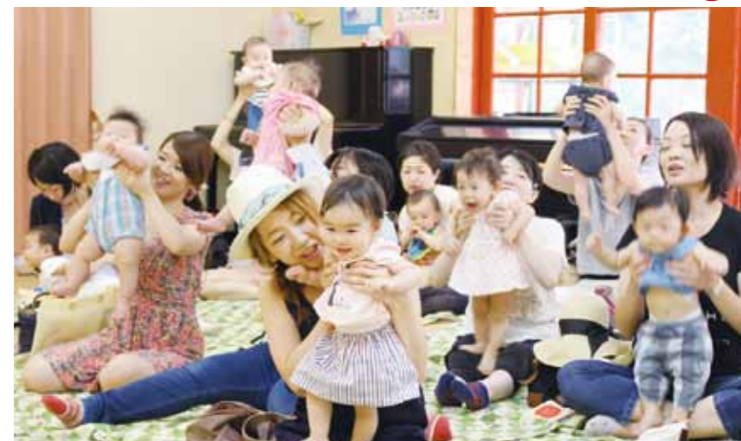
毎月第1水曜日(こどもたちの笑顔が広がる)の広場で行われる「だんごえはま」。こどもたちの笑顔が広がります!

を読むときは、親も子ども息が抜けて良かったなど、今、子育てをしている皆さんに伝えたいです。