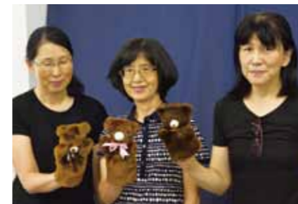
手作りのパペット人形。クマさんと一緒に歌いましょう!