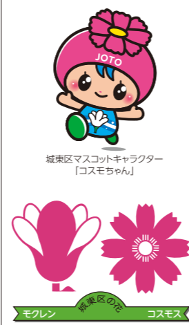
城東区マスコットキャラクター「コスモちゃん」