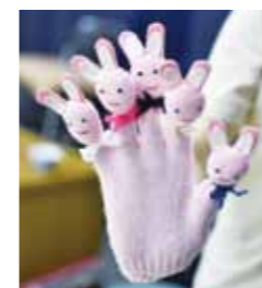
色つきの軍手に耳をつけて、目玉もつけて…うさぎに大変身!手作りの小物で、おはなしを盛り上げます

最近、メールなど一人で読む電子媒体が多くなりました。でも、絵本は、子どもとのコミュニケーションを深め、子どもたちに心の栄養を与えてくれるもの。それに、私が子育てをしていた頃、昼間は怒鳴ることもありましたが、夜に絵本