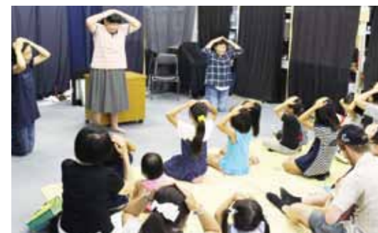
みんなで一緒に、楽しく手あそび

小さいときに読んでもらった同じ絵本が、今度は子どもたちに受け継がれて…絵本って、世代を超えて愛されていくもの。私たちは、そんな絵本をたくさんの人に読んでもらえることをめざして活動しています。