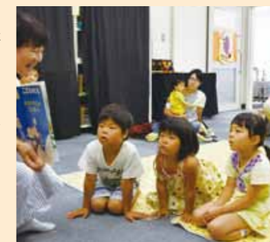
城東図書館での「水曜おたのしみ会」

城東図書館では、毎週水曜日に「水曜おたのしみ会」、4月に「春のおはなし会」を担当しています。おはなしは昔話を中心です。機械音のあふれる現代、昔の人が残してくれた無形の遺産を、生の声で子どもたちに伝え、おはなしの世界の楽しさを感じてもらいたいと願っています。